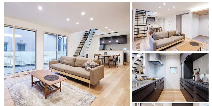
※実際の建物を撮影した写真です。(2024年3月撮影)