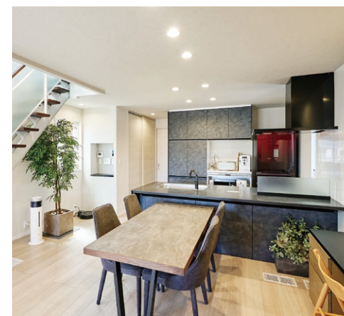
※実際の建物を撮影した写真です。(2024年3月撮影)