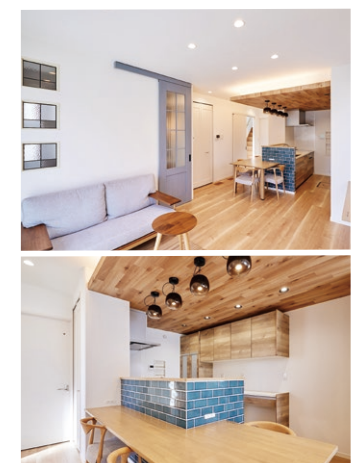
※実際の建物を撮影した写真です。(2024年3月撮影)